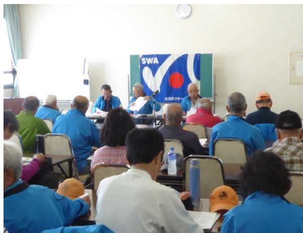
草津まちづくりセンターにて総会が行われる

休憩の後、平成29年度の事業及び予算について、決算の結果を予算にどのように反映させているのかの質問が多く出され、予算(収入と支出)の執行に当たっては決算結果に沿う旨の説明をし、2時間10分に及び総会が終了しました。