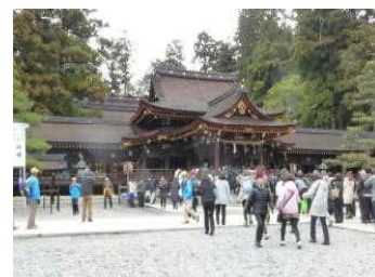
多賀大社 参拝客で賑わう

今年最初の例会。新しくなった彦根東口広場で、新年の挨拶が交わされる。曇り空であるが風もなく、気持ちよく歩ける。最初に野田山の金比羅さんに立ち寄り、手を合わせる。国道や裏道を通って行くうちに多賀のあけぼのパークに到着。図書館や博物館があり、裏には斜面を利用した広々とした公園ありで、皆さん思い思いの場所で昼食を摂る。