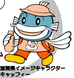
滋賀県イメージキャラクター キャラッピー