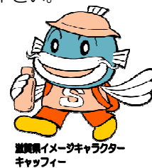
滋賀県イメージキャラクター キャプティン